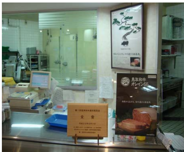
鳥取和牛オレイン 55 指定店の「お肉のはなふさ 鳥取大丸店」