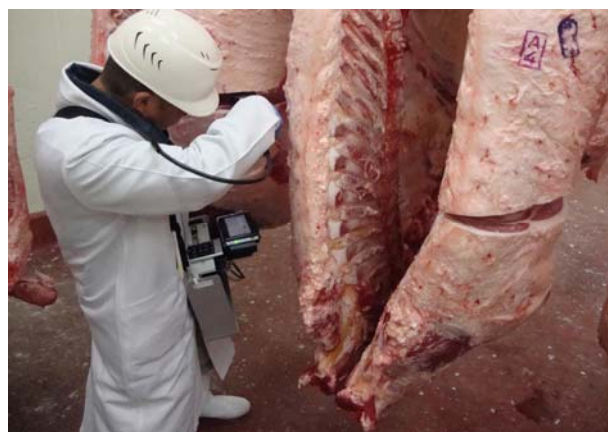
筋間脂肪のオレイン酸含有量を食肉脂質測定装置より測定

成果は、枝肉に付与されるプレミアム（100～150 円/kg）が発生率を高めるインセンティブになっており、生産農家の機運が高まってきていることである。また、平成 23 年 2 月の発表後、予想以上に反響があり、県外も含めて、指定店の申請店舗が増えたことである。一方で、末端の消費者に情報提供する飲食店等指定店のさらなる開拓が課題