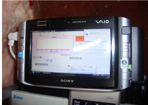
ディスプレイに表示されるオレイン酸含有量

鳥取県が以前から進めていた脂肪に含まれるオレイン酸の研究に着目していた。不飽和脂肪酸の一種であるオレイン酸は融点が低く、含有量が高まると牛肉の「美味しさ」に関係する口溶けや風味が増すという研究結果がある。また、「気高」号の血統が濃くなるほど、オレイン酸含量が高くなる傾向があることもわかった。これが、当該ブランドの創設につながっている。「試験研究に裏付けられたブランド化」である。当県は、もともと肉牛の産地でなく繁殖県であり、頭数の少ない県なので、大産地優位の「格付等級」の土俵で勝負しても意味がないものと考えてきた。