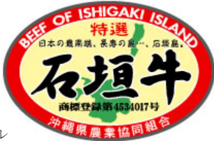
写真2：各取扱店・スーパー等で使用されているラベル